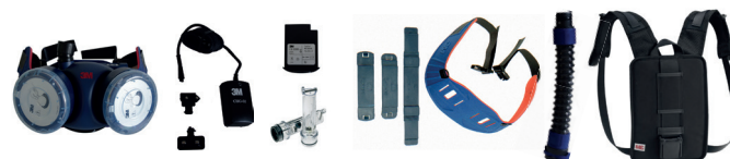
modèle avec ceinture + harnais

Document annexe : Instruction de montage