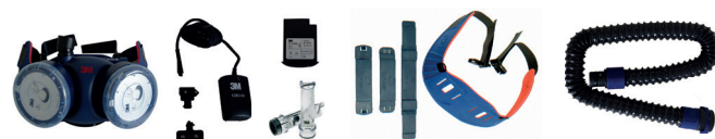
modèle avec ceinture